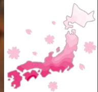
今月作成いただいた壁画「春風」です